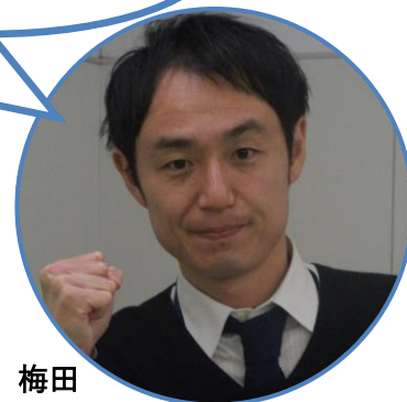
教室スタッフ 梅田